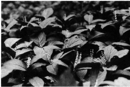
写真-4 フタリシズカ(センリョウ科)