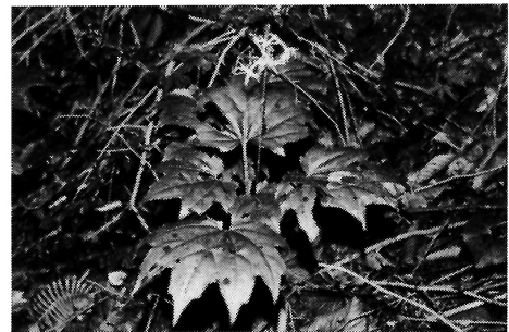
写真-13 モミジハグマ(キク科)