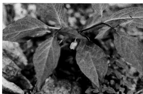
写真-7 ハダカホオズギ(ナス科)