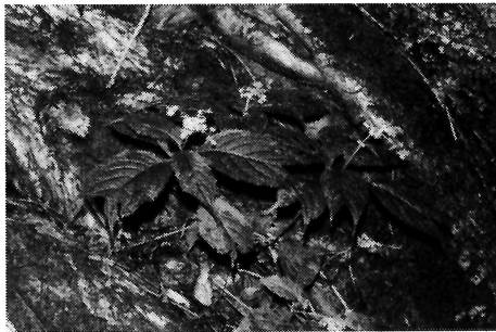
写真-10 ギンバイソウ(ユキノシタ科)