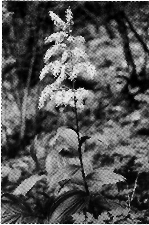
写真-1 バイケイソウ (ユリ科)