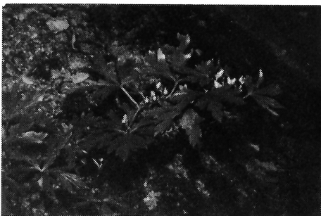
写真-6 タンナトリカブト(キンポウゲ科)