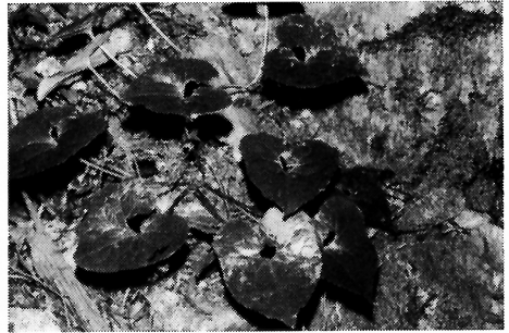
写真-9 クロフネサイシン(ウマノスズクサ科)