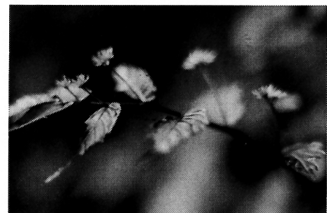
写真-15 ウワバミソウ(イラクサ科)