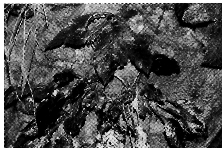
写真-14 イワタバコ(イワタバコ科)