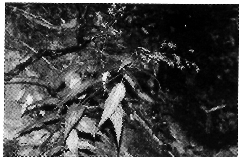
写真-5 ソバナ(キキョウ科)