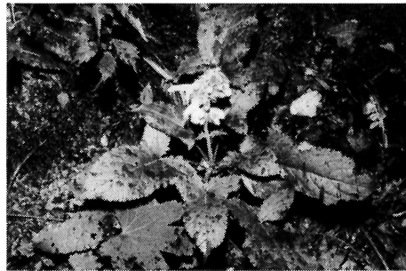
写真-12 キバナアキギリ(シソ科)