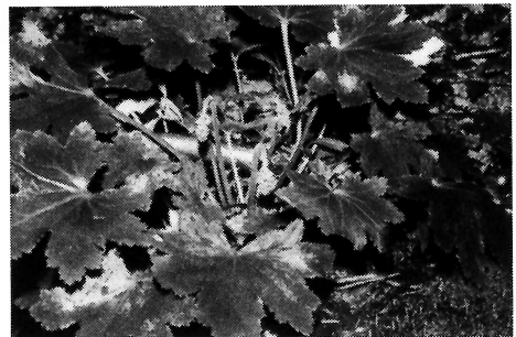
写真-11 ジンソウ(ユキノシタ科)