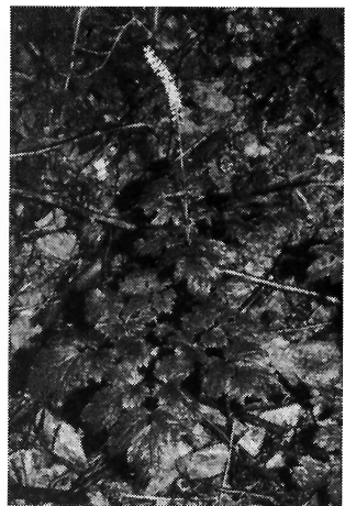
写真-3 ルイヨウショウマ (キンポウゲ科)